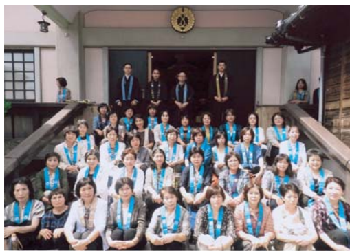
早良組仏教若婦人会 金子みすずゆかりの仙崎-遍照寺を訪ねて 2012年9月6日(水) 1号車